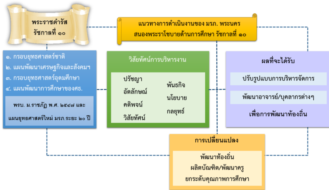
แผนภูมิแสดง วิสัยทัศน์การบริหารงาน มหาวิทยาลัยราชภัฏพระนคร